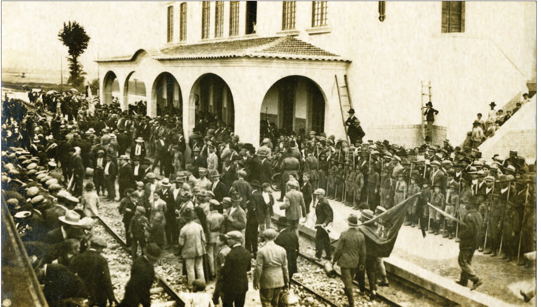
ESTAÇÃO DE CHAVES