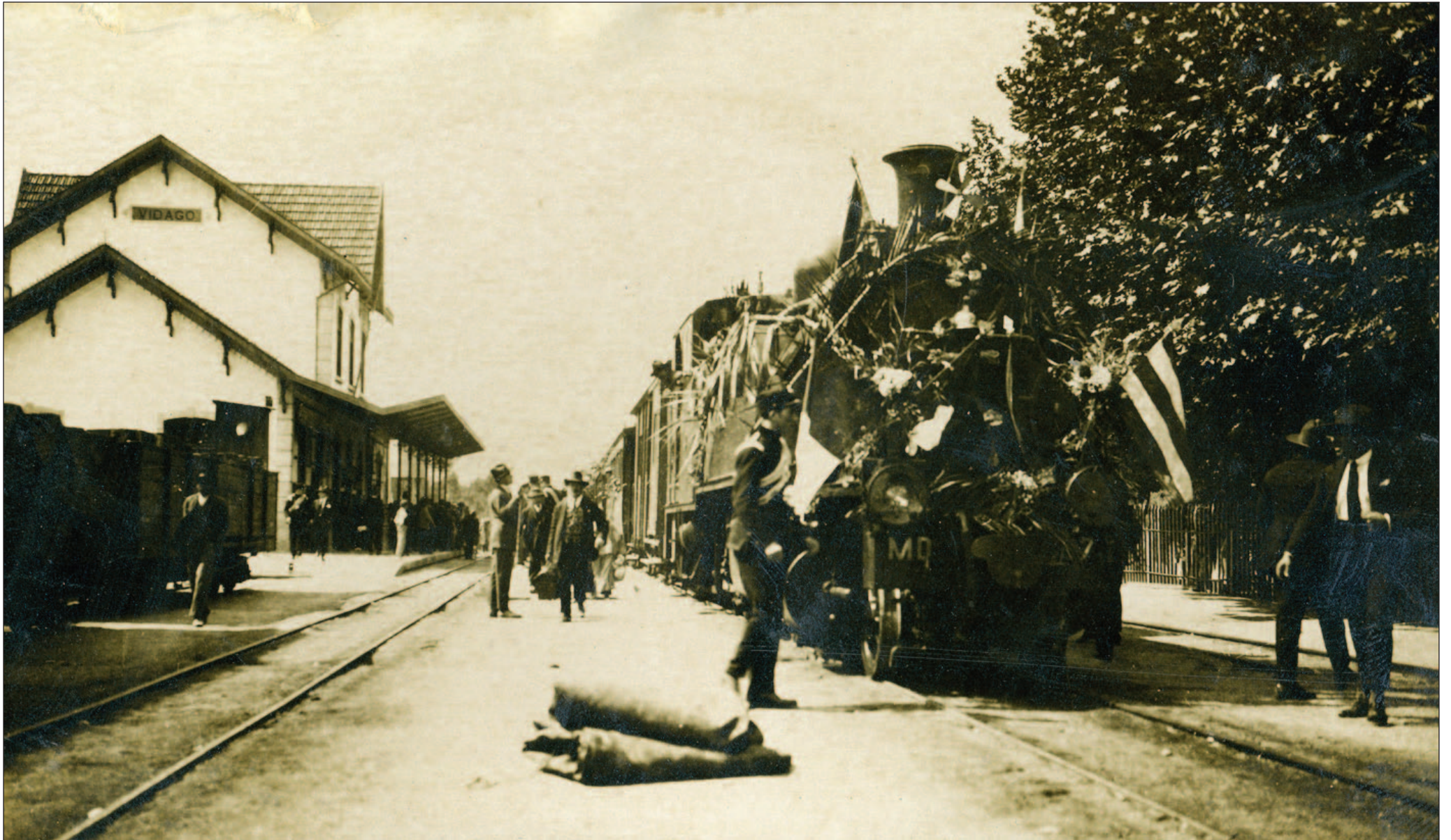
ESTAÇÃO DE VIDAGO