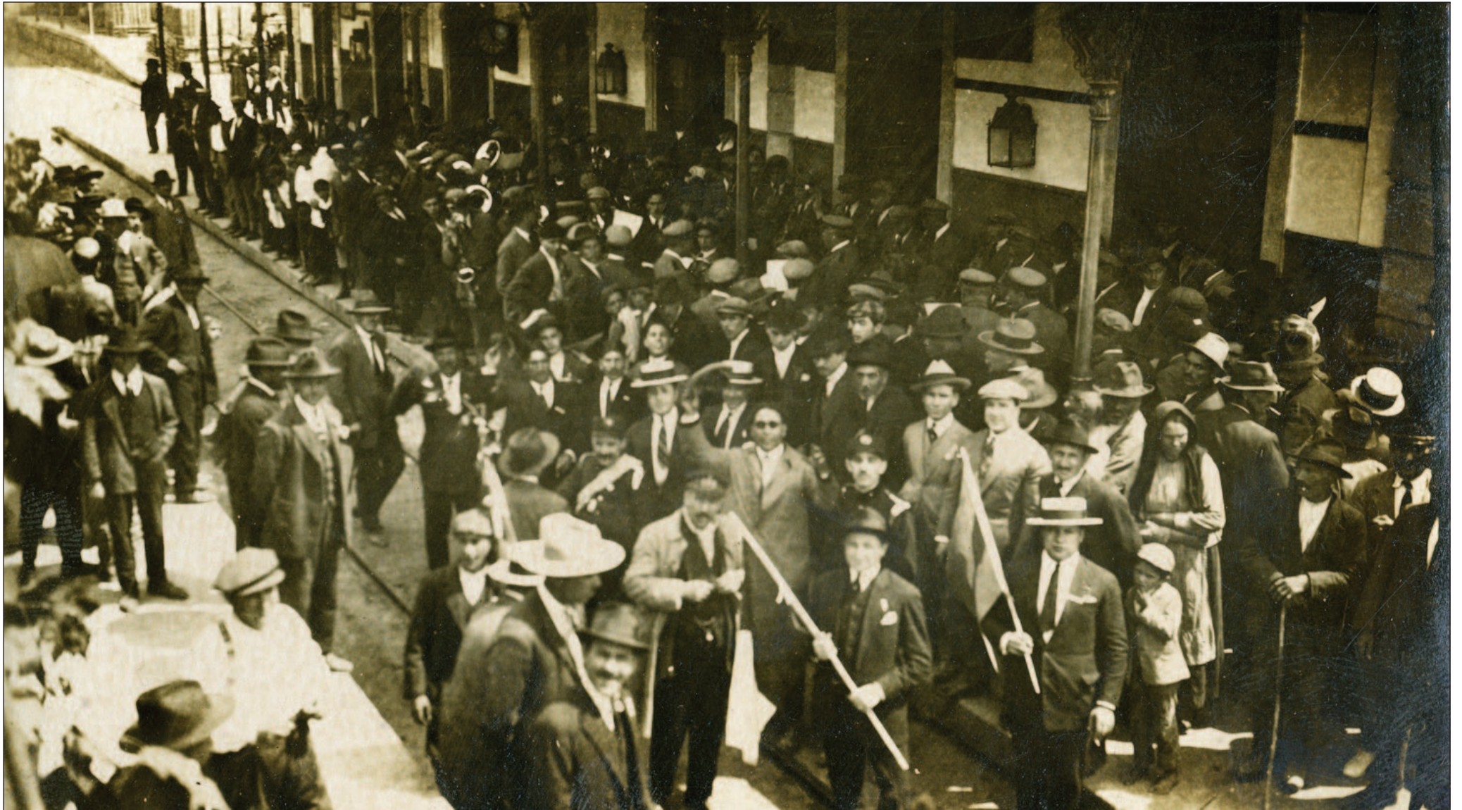
ESTAÇÃO DE VIDAGO