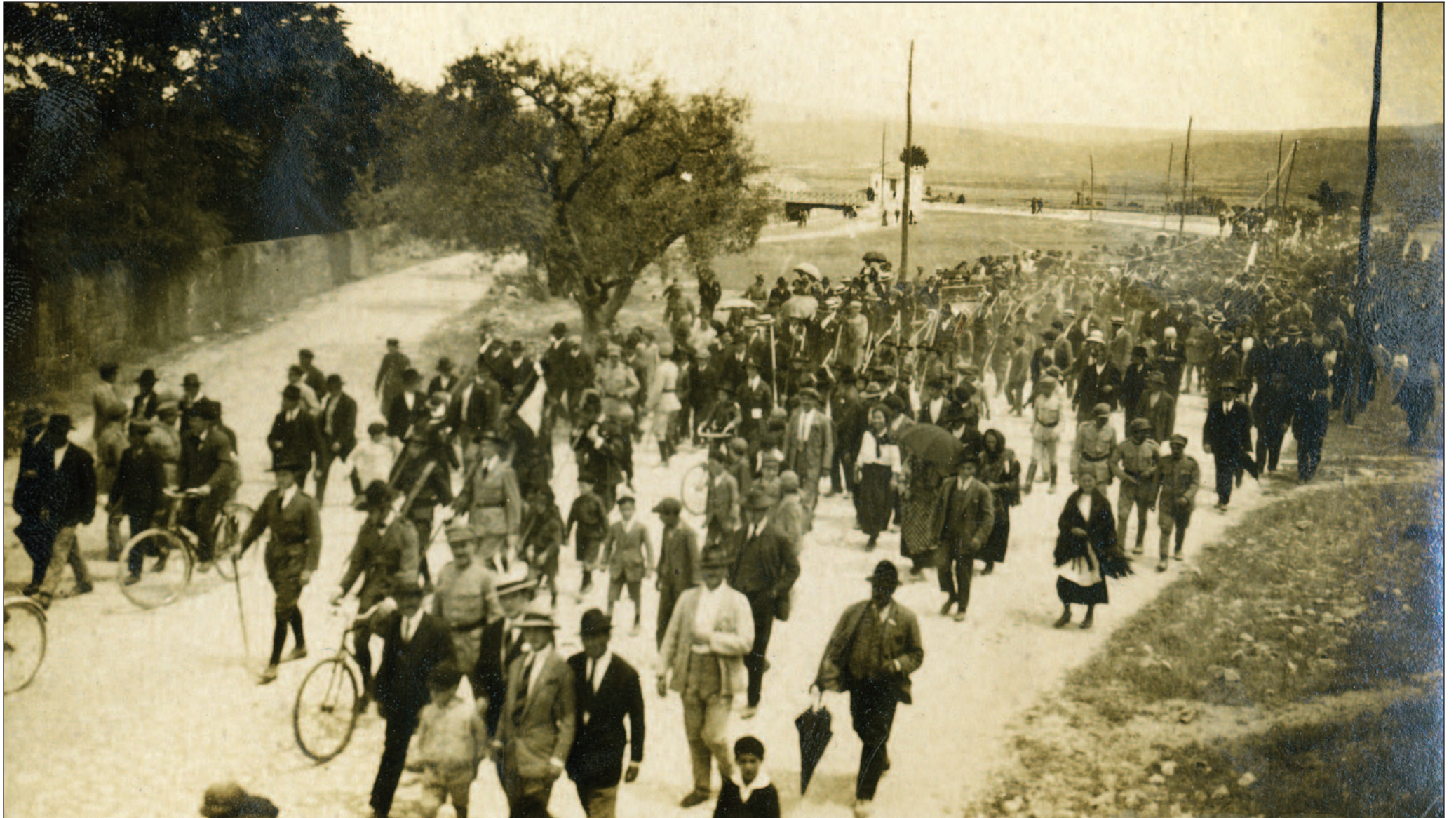
ESTAÇÃO DE CHAVES