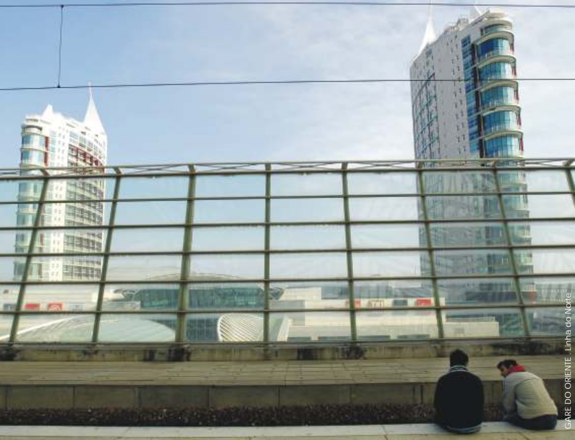
GARE DO ORIENTE - Linha do Norte

propriedade Rede Ferroviária Nacional REFER EP